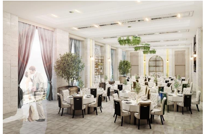
ラガナヴェール プレミア バンケット (イメージ)