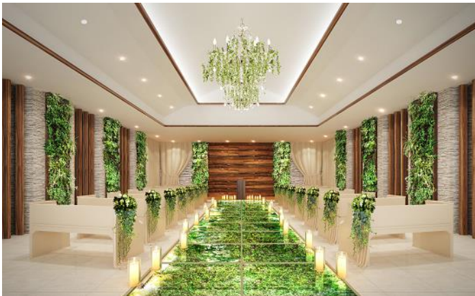
ザ ライブラリー チャペル (イメージ)

年間約8,000組の結婚式を手掛けているエスクリは、今後も多様化する結婚式のニーズやモチベーションに応えるとともに、市場の活性化に取り組んでまいります。