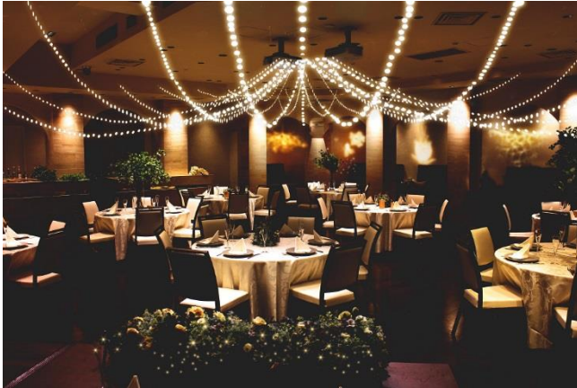
パラッツォ ドゥカーレ 麻布 バンケット (イメージ)